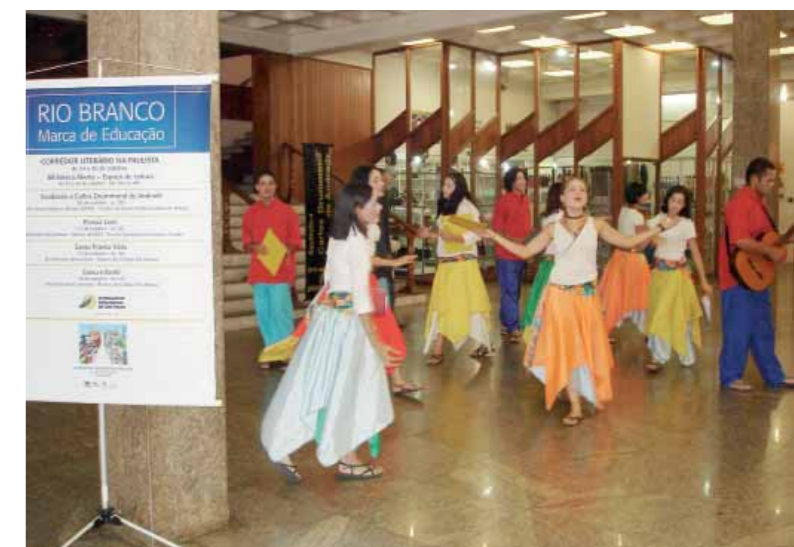
Grupo de jovens atores do CEPRO no Clube Homs