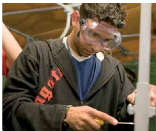
Instalações Elétricas Prediais