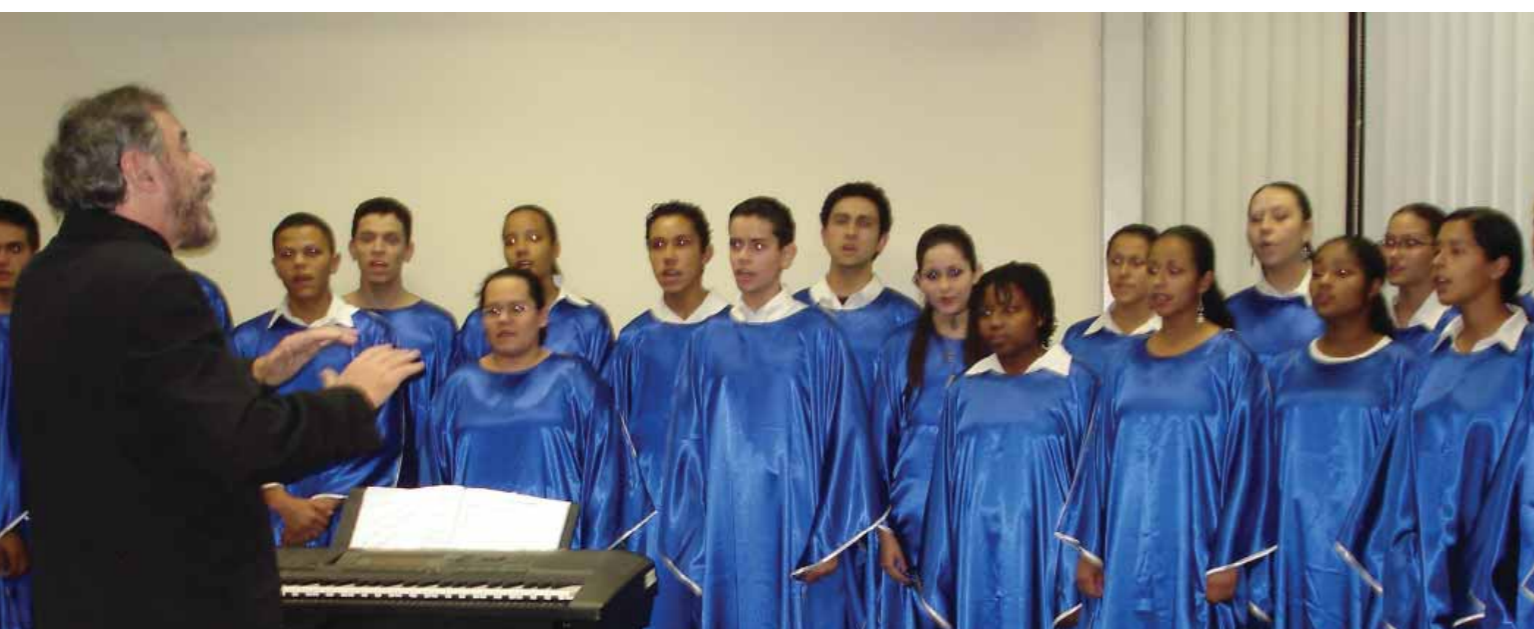
Coral do Centro Profissionalizante Rio Branco