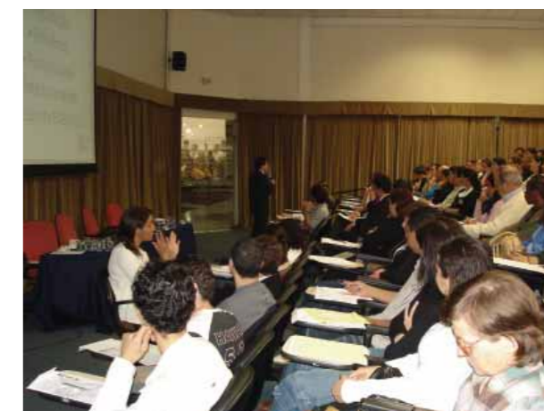
Semana de Empreendedorismo