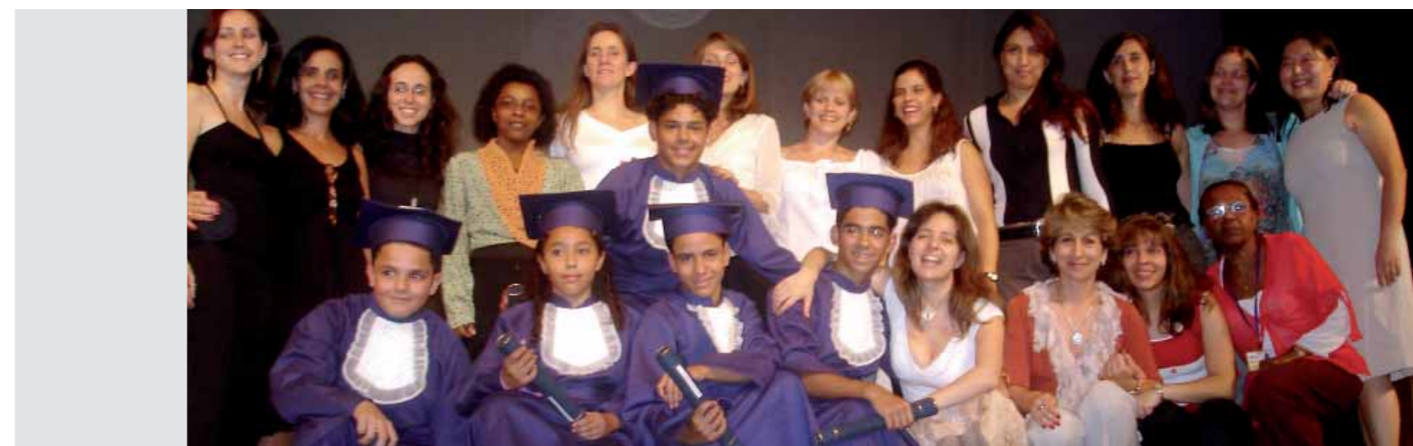
Formatura dos alunos da Escola para Crianças Surdas Rio Branco