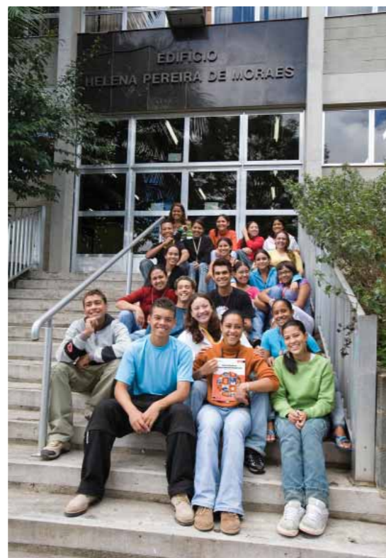
Grupo de alunos do programa entra 21

Em 2005, o CEPRO Rio Branco participou em eventos externos, como palestras realizadas nas duas unidades do Colégio Rio Branco, nas Faculdades Integradas Rio Branco, na Escola para Crianças Surdas Rio Branco. Recebeu visitas interessadas em conhecer a sua proposta de trabalho, seus cursos e estabelecimento de parcerias. Por sua vez, a equipe do CEPRO Rio Branco realizou visitas externas para divulgar o seu trabalho e conhecer outros programas profissionalizantes, visando a disseminar a instituição e prospectar novas possibilidades de parcerias.