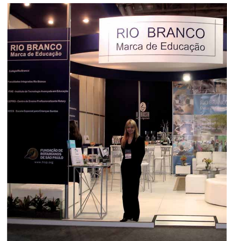
Estande do Rio Branco na feira Expomanagement - HSM