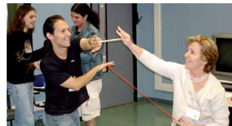
Oficina da Jornada de Profissões