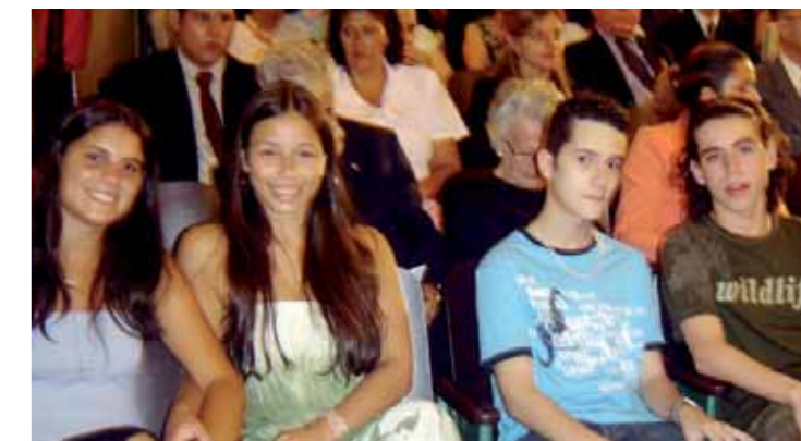
Alunos premiados no Instituto Histórico e Geográfico

O estímulo às Artes e a valorização da História estão entre as atividades extracurriculares desenvolvidas pelo Colégio Rio Branco.