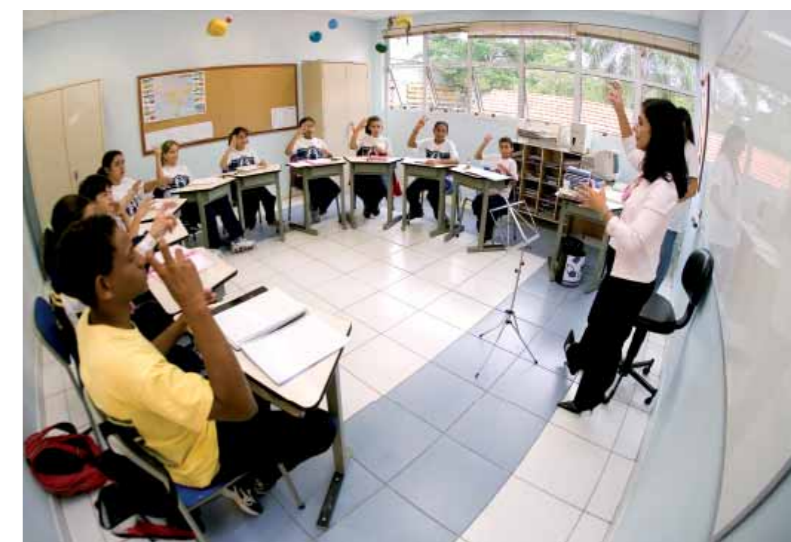
Salas de Aula

Neste ciclo, foram atendidos 41 alunos em classes de 1ª a 4ª série, em período integral. Os projetos interclasses marcaram o ano. Ao final de cada projeto, os trabalhos foram apresentados para as outras turmas e alguns