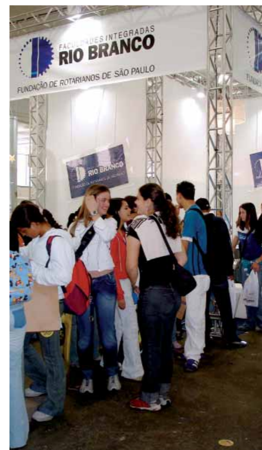
Estande das Faculdades na Fevest 2005

Além dos colégios, as Faculdades marcaram presença na Fevest, maior feira para vestibulandos de São Paulo.