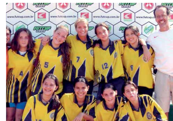
Esportistas no Futcup 2005

O incentivo à prática de esportes, em busca de melhor qualidade de vida, ao mesmo tempo em que estimula o companheirismo, a convivência social e a integração do grupo, é fortemente trabalhado pelo Colégio Rio Branco. Os esportes estiveram em pauta durante o ano todo, com a realização de campeonatos internos de diversas modalidades entre as equipes. Os esportistas das duas unidades também participaram de alguns eventos externos, como campeonatos intercolegiais, trazendo títulos e medalhas para o Rio Branco.