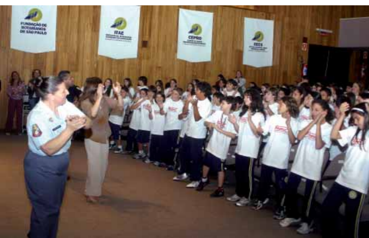
Encerramento da Proerd 2005