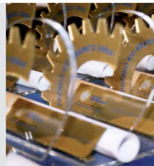
Prêmio Rio Branco – reconhecimento ao aluno