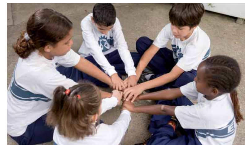
Interação e sociabilização na Escola para Crianças Surdas Rio Branco

Durante o ano, dois momentos foram marcantes: a participação no Corredor Literário da Paulista, onde os alunos de 3ª e 4ª séries apresentaram poesias em Libras na entrada do Clube Homs, criadas por eles especialmente para o evento; a participação no Concerto de Natal do Colégio Rio Branco, juntamente com alunos do CEPRO e do Colégio, quando mostraram a arte e a cultura surdas, por meio de declamação de poesias em Libras.