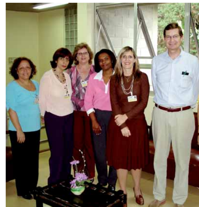
Vice-presidente da IYF Peter Shiras com a equipe do CEPRO Rio Branco

A Fundação recebeu integrantes de Grupos de Estudos (IGE), programa desenvolvido pelo Rotary International, pelo qual profissionais de diversas áreas trocam experiências ligadas à sua profissão e conhecem a cultura de outros países. Visitaram a Fundação os seguintes grupos: Inglaterra, dias 6 e 9 de maio, Colômbia, dia 1º de junho e Coréia do Sul, dia 3 de junho.