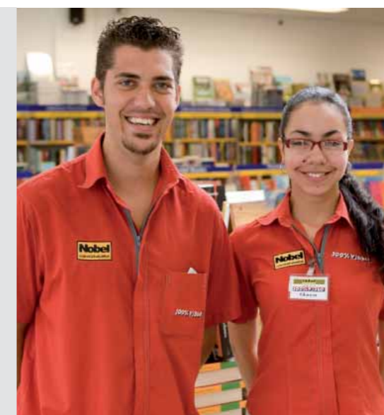
Jovens contratados pelo Programa de Inserção ao Mercado de Trabalho

O curso de Artes Visuais e Serigrafia expôs a sua produção de quadros na festa de confraternização de 2005 da Fundação, realizada em dezembro, na Granja Vianna. O objetivo foi promover a divulgação do CEPRO Rio Branco e mostrar o talento dos alunos.