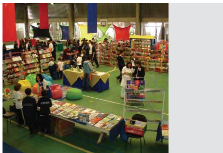
Feira do livro unidade Granja Vianna

Para incentivar o hábito da leitura e o contato com a variedade de gêneros literários e com alguns escritores, realizou-se a Feira do Livro. Com o tema " Colcha de Retalhos do Colégio Rio Branco - construindo as diversas manifestações artísticas", os estudantes demonstraram seu talento nas artes, cantando, pintando, criando e encenando, em um encontro que envolveu alunos e familiares da Educação Infantil ao Ensino Médio.