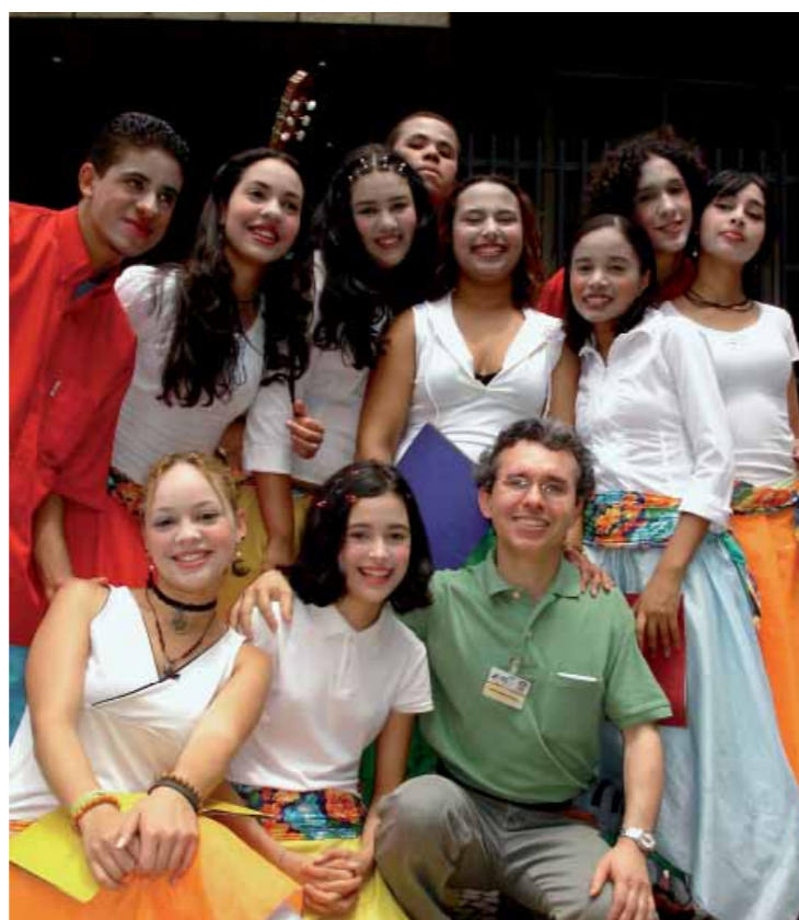
Grupo de jovens atores e poetas do CEPRO Rio Branco

A Oficina de Empregabilidade, que existe para preparar o jovem para o processo seletivo nas empresas, abordou temas importantes como postura, dicas para a primeira entrevista de