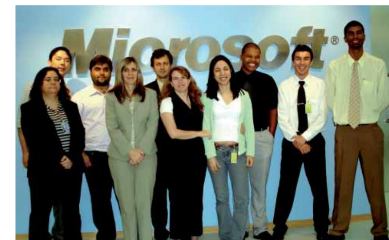
Equipe da Fundação de Rotarianos de São Paulo em parceria com a Microsoft

Durante o ano, o Mutirão Digital manteve o suporte técnico-pedagógico nas escolas-piloto Alfredo Paulino e Guilherme Kuhlmann, para implementar a WebQuest para os alunos. A mostra de resultados da aprendizagem com esse suporte foi realizada na Feira Cultural de final de ano nas escolas, com exposição dos trabalhos desenvolvidos.