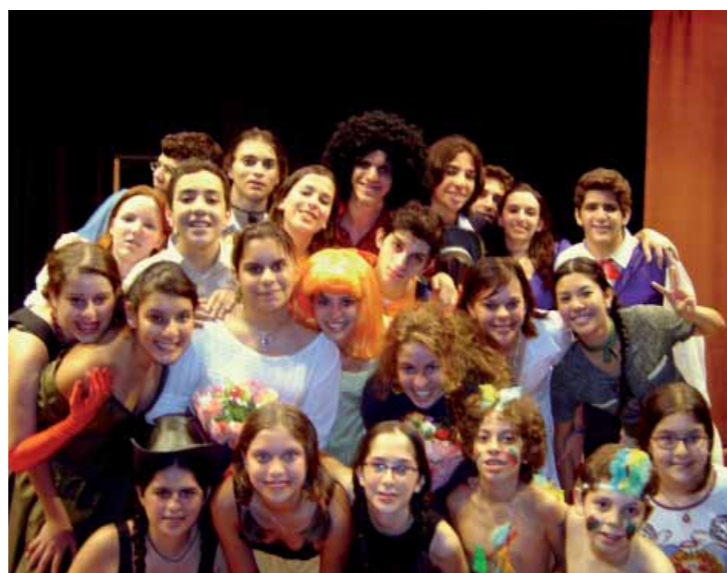
Grupo de teatro Rio Branco

A atividade do Grupo de Teatro Rio Branco teve como objetivo ampliar o universo de conhecimentos dos alunos, desenvolvendo novas linguagens e habilidades de comunicação e expressão. Foram realizadas apresentações como: " Tribobó City" de Maria Clara Machado, na Unidade Granja Vianna; " O Bem-Amado", de Dias Gomes, na Granja Vianna e Higienópolis e no I Festival Estudantil de Teatro – Rede Estância Brasil; " Uma História da China" com alunos do Fundamental I, na Granja Vianna; apresentação conjunta das duas unidades da peça " Em Tempos de Guerra", uma criação coletiva a partir do estudo de guerras étnicas, incorporando cenas da obra " Terror e Miséria no III Reich", de Bertold Brecht; participação na IV Mostra de Teatro Intercolegial no Colégio São Luiz, apresentando a peça " Em Tempos de Guerra".