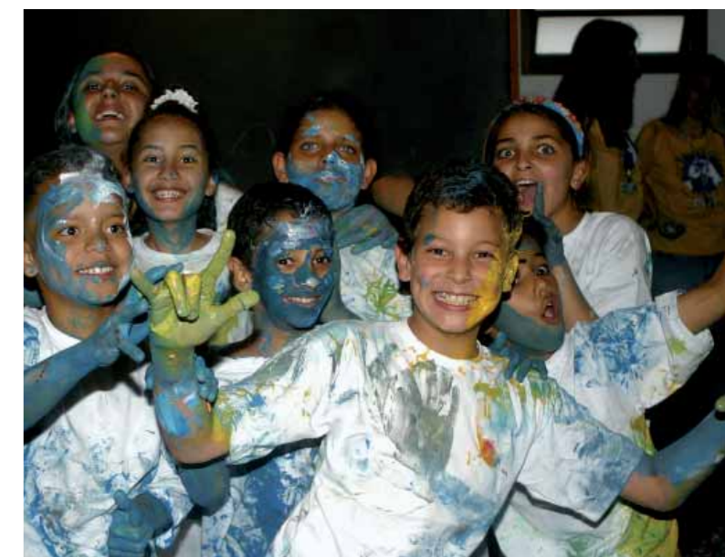
Apresentação dos alunos no V Encontro do Dia do Surdo