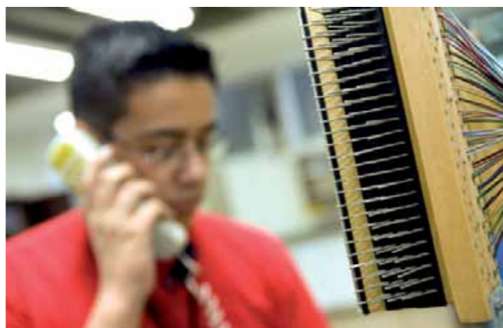
Básico em telefonia

O primeiro passo para ingresso no CEPRO Rio Branco é o processo seletivo, para jovens entre 14 e 18 anos cursando, no mínimo, a 5ª série do Ensino Fundamental I, com renda familiar entre 2 e 10 salários mínimos. Eles fazem uma prova classificatória e passam por uma avaliação socioeconômica. Os selecionados habilitam-se ao Programa de Capacitação Básica para o Trabalho-PCBT, visando a desenvolver um conjunto de competências básicas para o mercado de trabalho e o comportamento de cidadãos responsáveis.