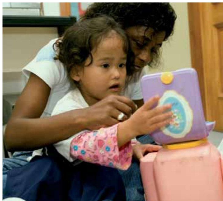
Atividade do programa de desenvolvimento

O programa é o primeiro passo na educação de crianças pequenas na Escola para Crianças Surdas Rio Branco, atendendo à faixa etária de 0 a 3 anos. A escola viabiliza o contato continuado