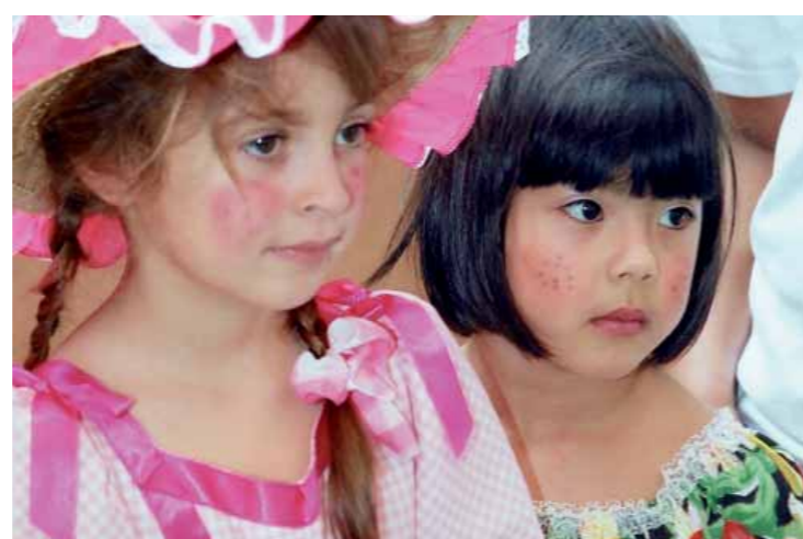
Festa Junina – unidade Higienóplis