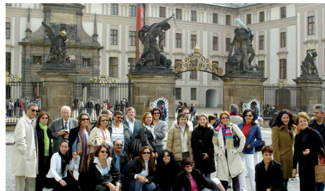
Grupo de educadores na Europa

- Recepção de personalidades do Rotary (presidentes, diretores), VIPs, autoridades, grupos de intercâmbio (IGE, jovens, bolsistas, Rotaract, Interact) e visitantes internacionais. - Orientação e informação institucional a rotarianos e colaboradores diretos e indiretos em suas viagens ao exterior, para a difusão das atividades da CIP/PLOP e da FRSP.