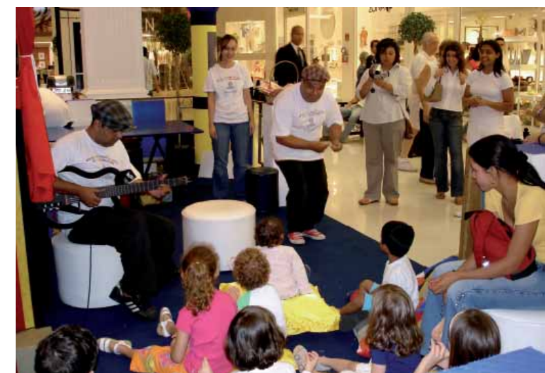
Comemoração do dia das crianças no Shopping Pátio Higienópolis

Como parte do projeto de orientação vocacional do Colégio Rio Branco, a Jornada de Profissões, realizada em parceria com as Faculdades Integradas Rio Branco, visa a orientar os alunos do Ensino Médio na escolha de sua futura carreira profissional, oferecendo subsídios para que possam avaliar seus interesses, aptidões e habilidades frente ao mercado de trabalho. O evento apresentou uma programação de palestras e oficinas de diversas áreas profissionais, quando os alunos puderam vivenciar e se aprofundar sobre profissões e carreiras.