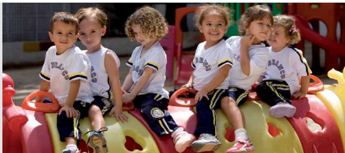
Educação Infantil – a formação integral do aluno