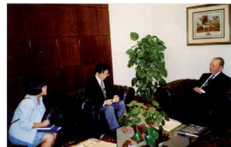
Cônsul do Japão Hitoshi Segá com o presidente da Fundação Eduardo de Barros Pimentel

Com o objetivo de intensificar a interação cultural e os contatos com instituições brasileiras voltadas à educação, cultura e artes, o cônsul geral do Japão em São Paulo, Hitoshi Segá, veio conhecer a Fundação. Essa iniciativa de aproximação visa fortalecer o intercâmbio educacional, cultural e artístico e a concessão de bolsas de estudos disponibilizadas pelo Japão a estudantes brasileiros.